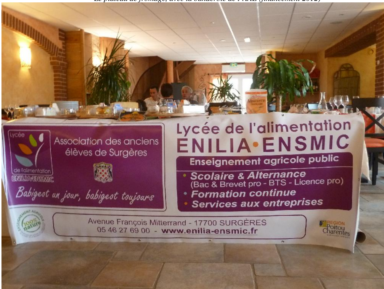
Le plateau de fromage, avec la banderole de l'AAE (financement 2012)

Association des Anciens Elèves de Surgères – route de la Rochelle – BP 49 – 17700 Surgères