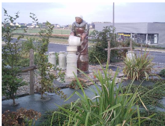
Le rond point face à la laiterie de Créhen (Cotes d'Armor)

Le 22 septembre dernier, le comité Bretagne de l'Association des Anciens Elèves de Surgères a organisé l'Assemblée Générale Ordinaire des Babigeots. Cette journée fut l'occasion de rassembler une quarantaine d'anciens élèves de Surgères.